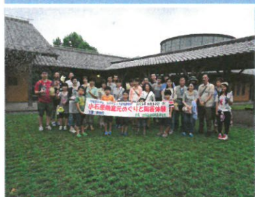
昨年度の集合写真

HP アドレス http://toho.main.jp/jyoukaryu-kouryu.html ※この上下流交流事業は、水源かん養基金事業として開催します。