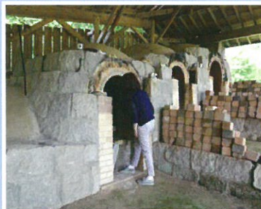
窯元の登り窯見学