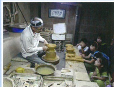
伝統技法の実演見学